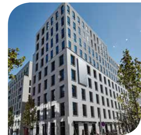
ARDEKO (SCI ARDEKO) - BOULOGNE-BILLANCOURT (92)